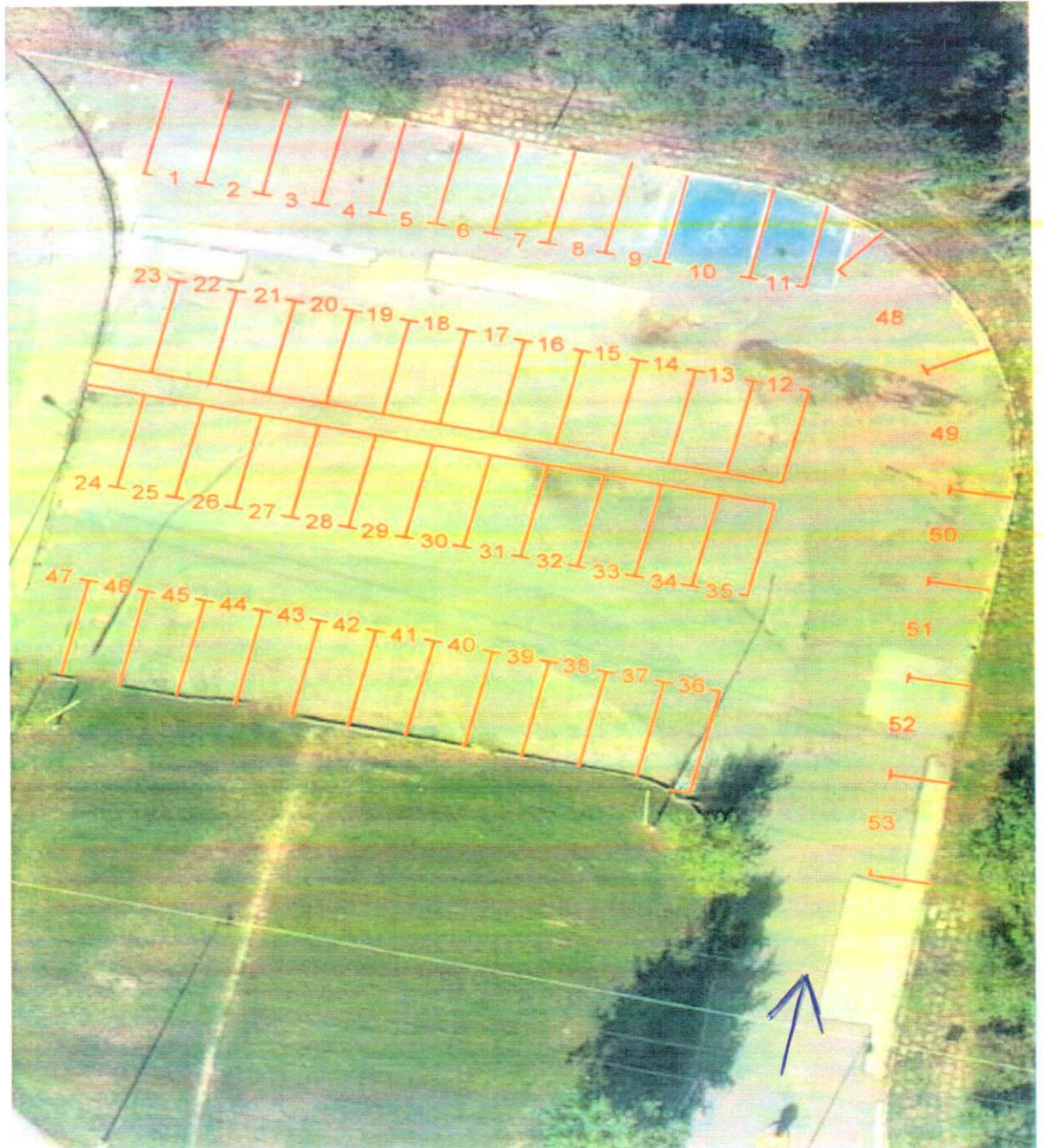
Rzut parkingu z wyznaczonymi i ponumerowanymi miejscami postojowymi